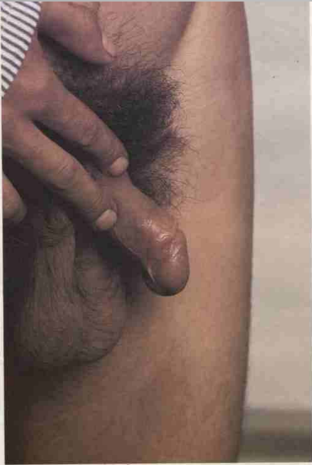
18. Syphilis primaria – ulcus durum