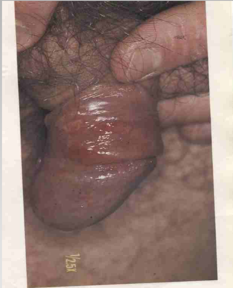
22. Syphilis primaria – erozivni typ.