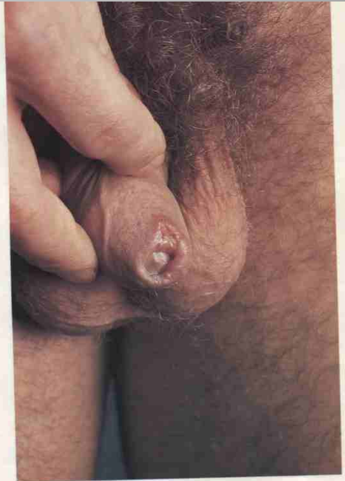
19. Syphilis primaria – ulcus durum